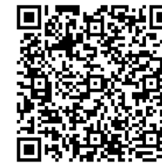
verwantschapstabel educatieve minor